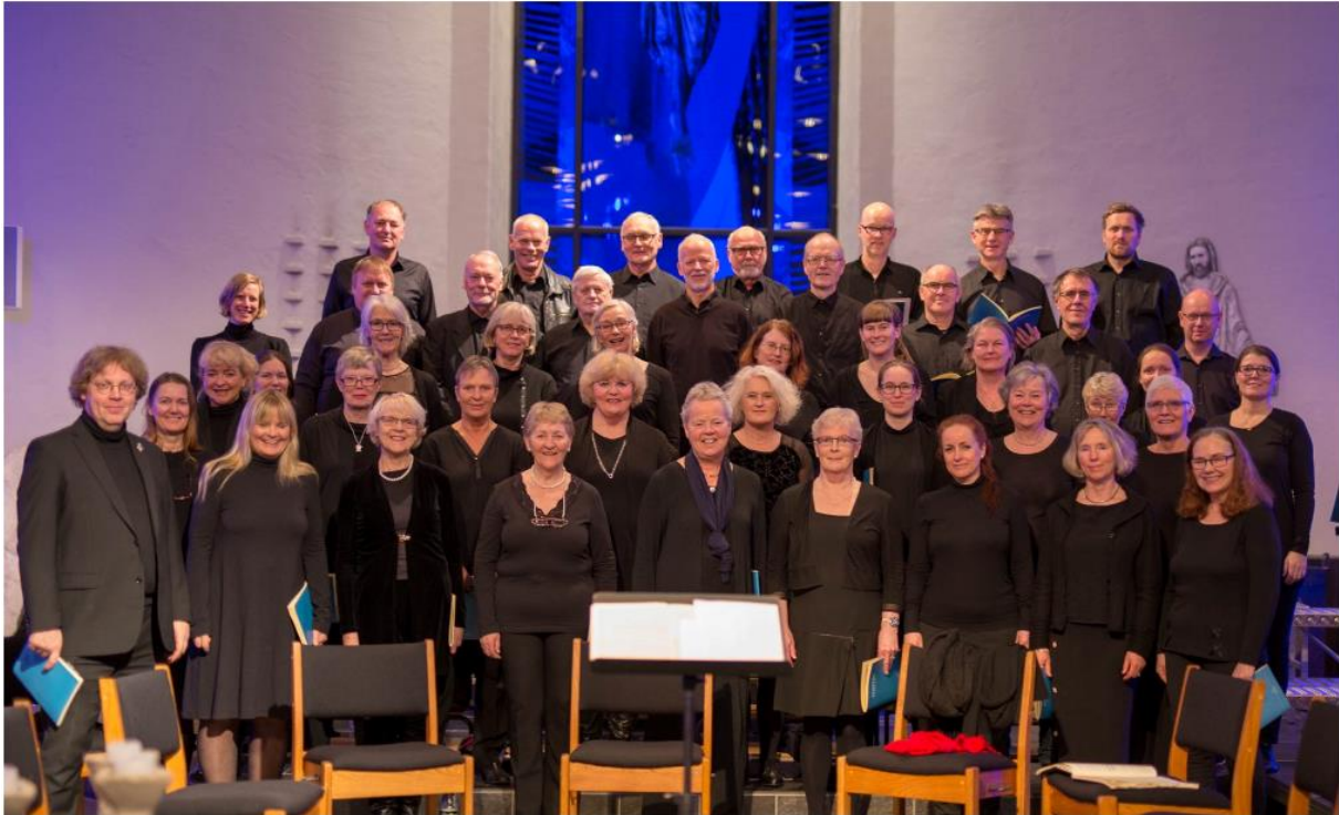
Fra konserten 21. mars i Riska kirke

Som del av avtalen med kirkevergen inngår at koret trer til side på øvelseskvelden dersom kirken disponeres av andre arrangører. En slik situasjon inntreffer ca. en gang pr. semester, og vi får da bruke St. Johannes kirke kostnadsfritt. Dette er en ordning som fungerer svært bra.