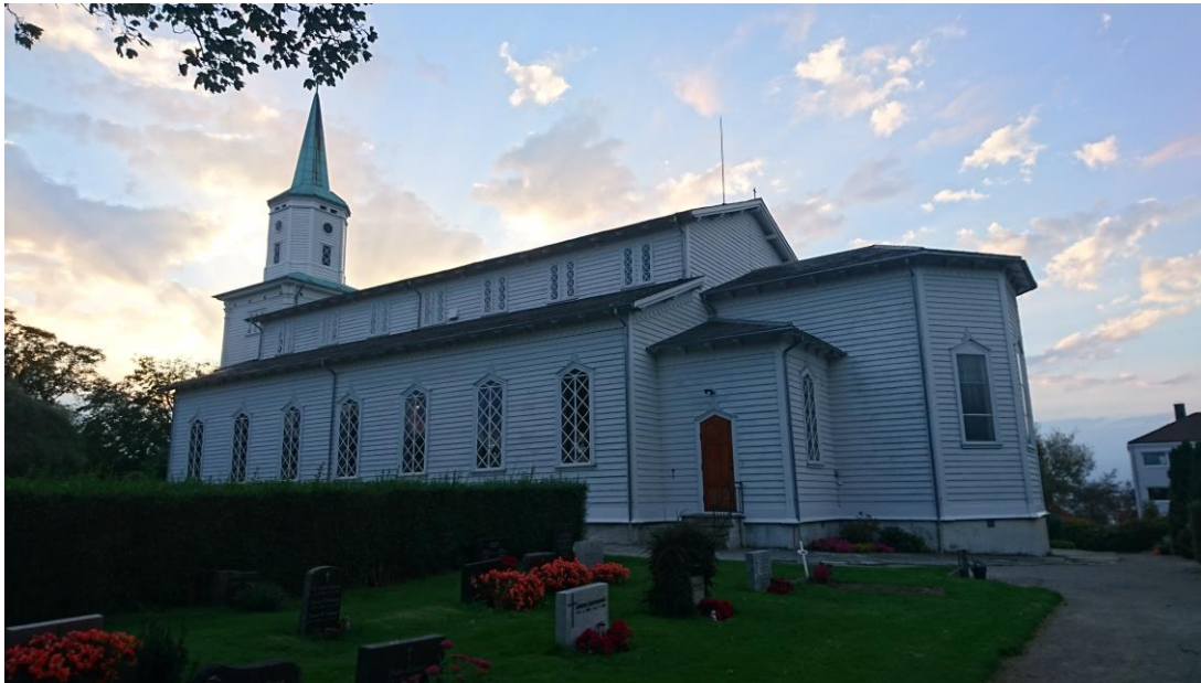
Frue kirke, Storhaugveien 2, Stavanger.

Kirken fungerer bra som øvings- og konsertlokale for koret, selv om det i vinterhalvåret kan være litt kaldt i lokalene, til tross for at vi setter på varmen mange timer på forhånd. Den sentrale og synlige beliggenheten av vårt øvingssted er, etter styrets mening, en faktor som bidrar til rekrutering av nye medlemmer i koret og publikum til våre konserter.